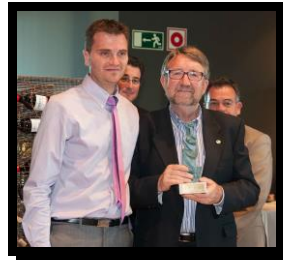
Algunos de los compañeros que recibieron Escultura-Homenaje